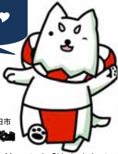
Mascote da Cidade de Iwata